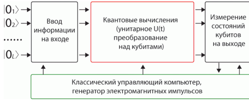
Рис. 4. Устройство квантового компьютера [1].